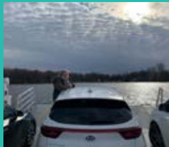
Traversée en ferry pour Hudson depuis Oka