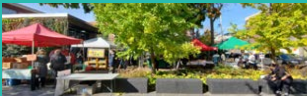
Marché Laurier (est)