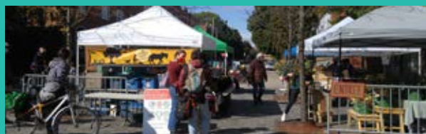
Laurier Marché (ouest)