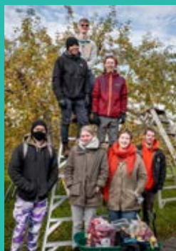
La cueillette des pommes

Comme nos deux bénévoles venus d'Allemagne sont arrivés plus tard que prévu, cette sortie a eu lieu tardivement, mais une première rencontre avait été organisée un peu plus tôt pour discuter des règles et des attentes à la résidence.